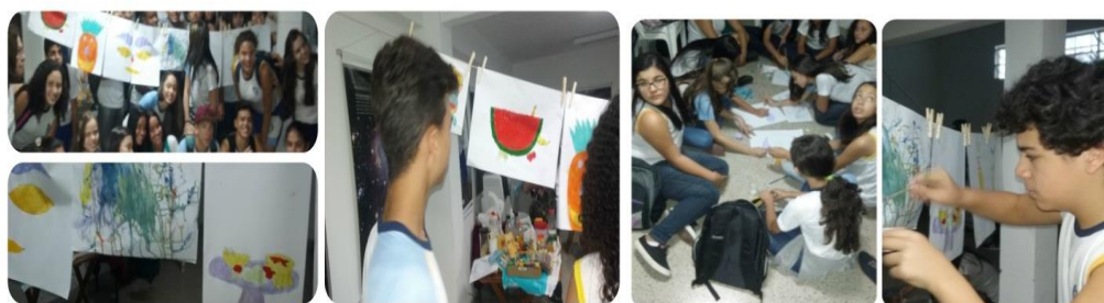
Figura 5: Estudantes desenhando com tintas elaboradas a partir de alimentos.

Como culminância desta etapa, os estudantes foram convidados a elaborar desenhos utilizando as tinturas elaboradas para a oficina, vivenciando, na prática, as múltiplas formas de uso dos alimentos.