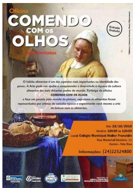
Figura 2: Cartaz da oficina. Detalhe obra Vermeer

Emiliano DI CAVALCANTI (1897 – 1976) Pintor, ilustrador, caricaturista, gravador, muralista, desenhista, jornalista, escritor e cenógrafo, este brasileiro dedicou-se aos temas nacionais. Peixes e laranjas foram retratados por eles.