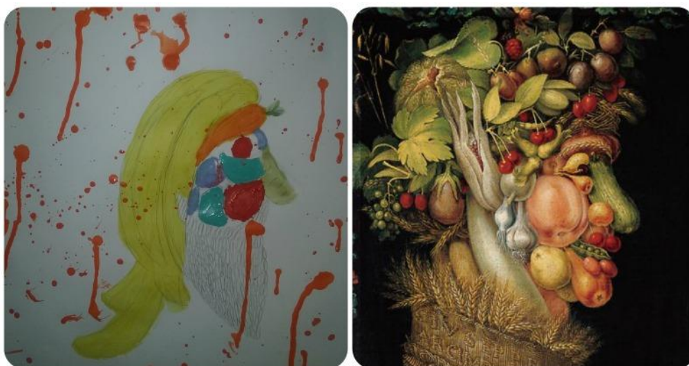
Figura 6: Desenho elaborado por aluno inspirado na obra "Verão" de Archimboldo.

TERCEIRO MOMENTO : Roda dialógica com os alunos sobre a atividade.