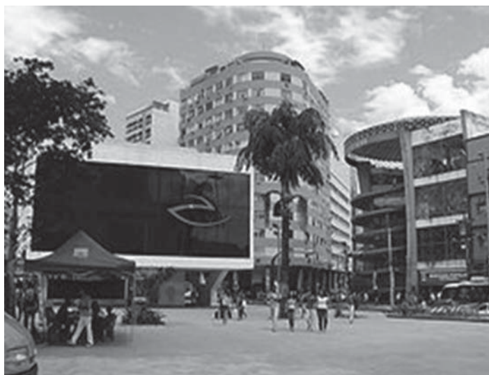
Figura 1.3: Município de Duque de Caxias – Polo do CEDERJ.