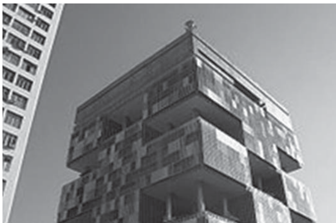
Figura 1.2: Edifício-sede da empresa da Petrobras no centro do Rio de Janeiro.

Assim que você optar pela instituição, dará início à primeira atividade de seu estágio, a sondagem do campo de estágio. Nesta etapa, você realizará uma pesquisa sobre os espaços não escolares que preveem a atuação de pedagogos, no município em que está realizando o estágio e, a seguir, passará à sondagem sobre a instituição escolhida como campo de estágio.