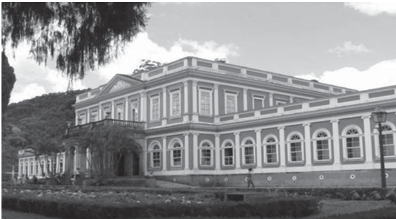
Figura 1.1: Museu Imperial de Petrópolis.