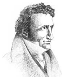
JEAN MARC GASPARD ITARD (1774 - 1838)

Aluno de Pestalozzi e criador de um sistema de educação especial para a primeira infância, aplicável a crianças deficientes mentais.