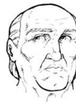
LUCIUS ANNAEUS SÊNECA Filósofo e poeta, nasceu em 4 a.C. e morreu em 65 d.C.

O marco inicial da ANTIGÜIDADE é o nascimento da escrita 4000 a.C. A Antigüidade inclui a ERA CRISTÃ , iniciada no ano 1 d.C.